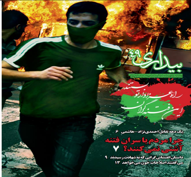
موضوع: فتنه سال ۱۳۸۸، نشریه بیداری شماره ۴۹