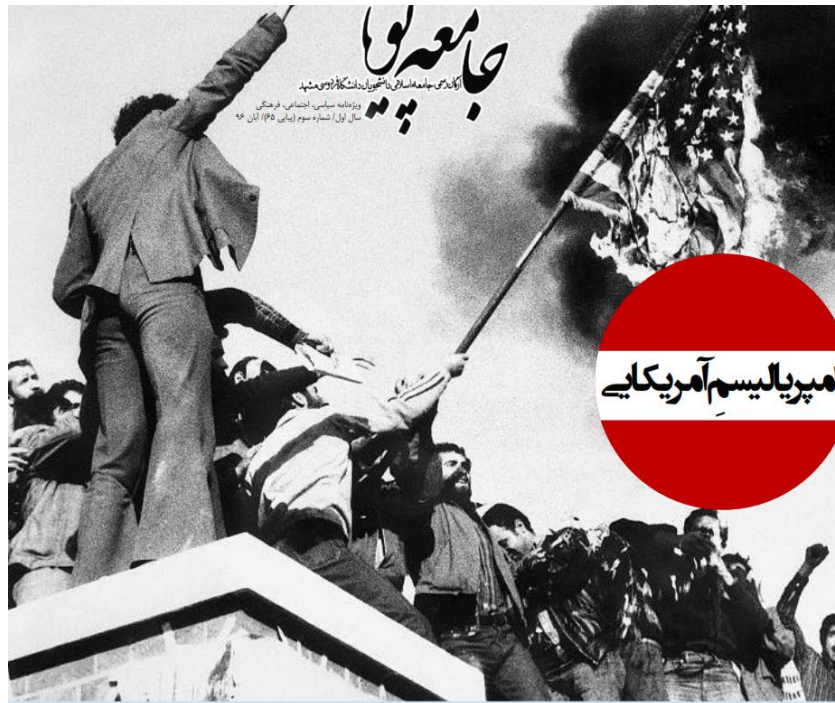
موضوع: تسخیر لانه جاسوسی، نشریه جامعه پویا شماره ۶۵