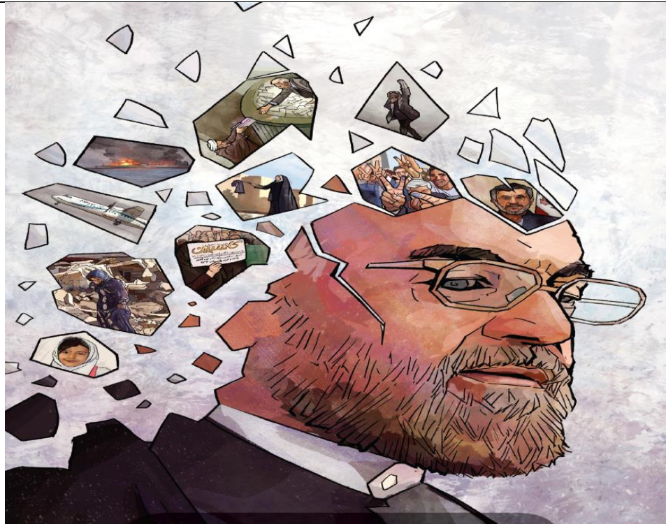
موضوع: نقد به دولت و عملکرد آن، نشریه وقایع اتفاقیه شماره ۴۴

۱۴. انتخاب تصاویر مرتبط با موضوعات مورد بحث و بررسی یکی از مهم‌ترین یافته‌های بدست آمده در این پژوهش است. تقریباً نزدیک به ۸۰ درصد نشریات از تصاویر بسیار آگاهانه و قابل تأمل جهت چاپ جلد استفاده می‌کنند. انتخاب و یا خلق این تصاویر به گونه‌ای است که زمان قابل تأملی خواننده را درگیر فهم موضوع و خلاقیت ارائه شده می‌سازد.